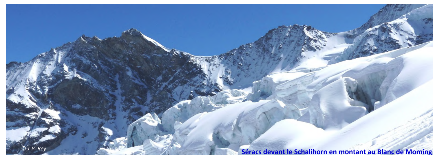
Séracs devant le Schalihorn en montant au Blanc de Moming